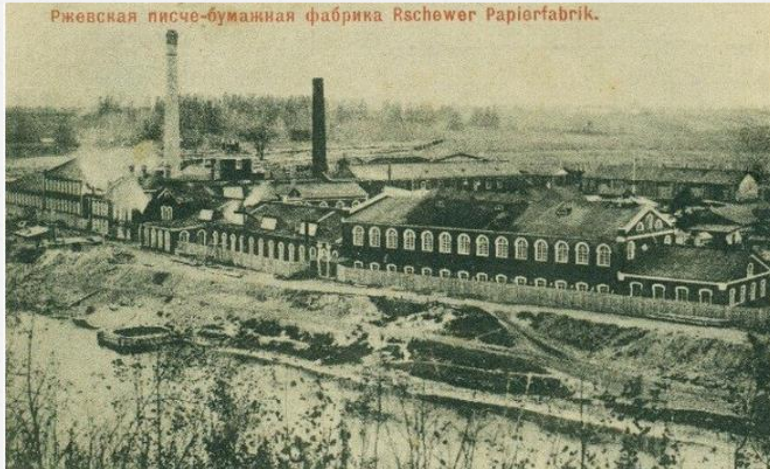
Ржевская писче-бумажная фабрика Rschewer Papierfabrik.